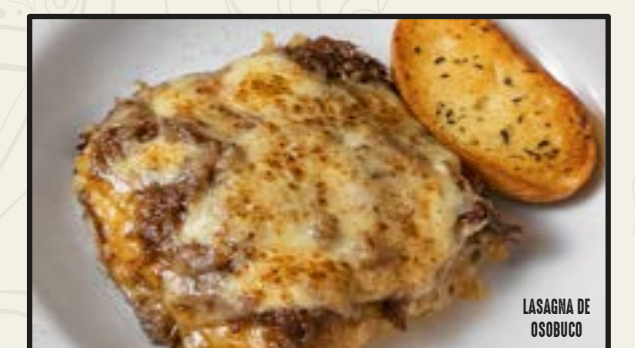
LASAGNA DE OSOBUCO